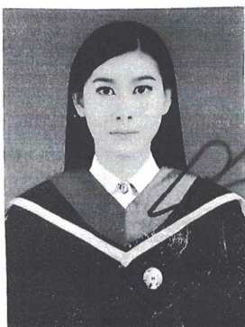
นายทะเบียนลงนามทำรูป

ให้ไว้ ณ วันที่ ๒ เดือน พฤษภาคม พ.ศ. ๒๕๖๓